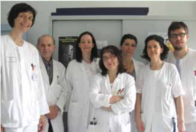
équipe ambulatorio Parkinson di Trento

A Trento , la prima visita bisogna prenotarla tramite CUP (848 816 816) chiedendo una visita neurologica per malattia di Parkinson. È necessario avere l'impegnativa del proprio medico di base. Le successive visite di controllo verranno concordate e prenotate direttamente dal neurologo con il paziente.