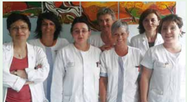
équipe ambulatorio Parkinson di Rovereto

Anche a Rovereto , la prima visita va prenotata tramite CUP (848 816 816) . Per necessità e informazioni urgenti telefonare al numero 0464/403512 .